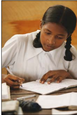
Los proyectos de alfabetización de Rotary han contribuido a mejorar las escuelas de Sri Lanka.

Según datos del UNICEF, mil millones de niños y adultos, aproximadamente el 15% de la población mundial, carecen de alfabetización básica. De acuerdo con la International Reading Association, entidad que colabora con numerosos clubes rotarios en proyectos de alfabetización, en los países en desarrollo, 113 millones de niños no están escolarizados y no aprenden a leer. En el ámbito mundial, aproximadamente 500 millones de mujeres son analfabetas (las dos terceras partes de la población mundial adulta analfabeta).