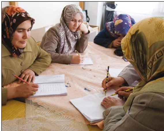
Uno de los programas intensivos patrocinado por Rotary en Turquía se centra en la alfabetización de mujeres adultas.

Estudios efectuados en países en desarrollo demuestran que la alfabetización, por básica que fuera la instrucción —y aunque sólo fuera de uno a tres años— puede disminuir la mortalidad infantil, y, según datos de la UNESCO, los hijos cuyas madres han cursado enseñanza primaria, tienen un 20% más de probabilidades de supervivencia que los de las madres analfabetas.