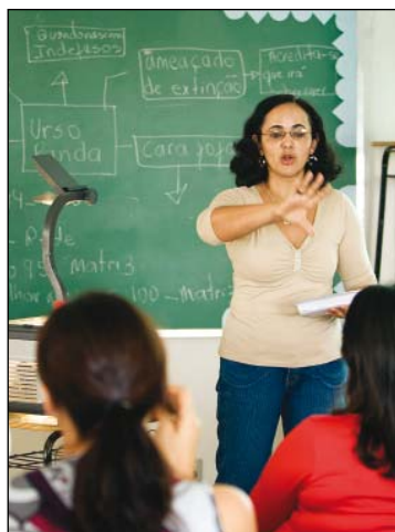
Con el apoyo de Rotary, más de 2.000 maestros brasileños aprendieron a utilizar el método CLE.

Método revolucionario preparado por rotarios ha servido para enseñar a leer a cientos de miles de personas